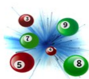
Tabellone della classe